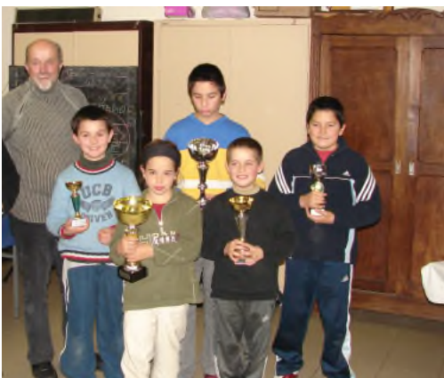
Les vainqueurs du Tournoi de Noël

La remise des prix, en présence de Monsieur le Maire, ainsi que l'apéritif et le repas qui ont suivi ont permis aux membres du club de se retrouver et de se souhaiter les vœux pour la nouvelle année. Merci encore aux bénévoles qui avaient dressé de superbes tables et effectué un service impeccable.