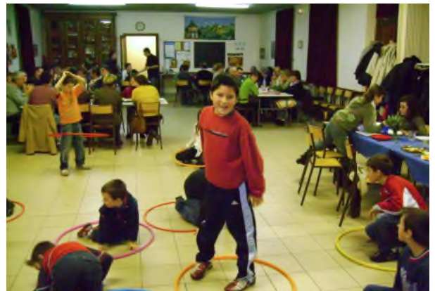
Pendant que certains mangent, d'autres jouent.