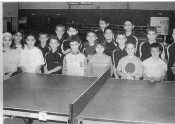
Les élèves de l'école de tennis de table.