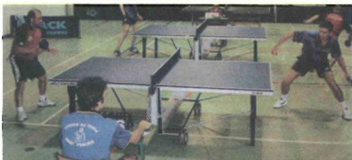
Le TTSP a dû s'incliner à deux reprises.

Ce week-end, le tennis de table saint-paulais recevait les deux équipes du club de Lacabarède pour la sixième journée du championnat de départementale 1 et 2. Malgré des sets très serrés, l'équipe de D1 saint-paulaise a dû s'incliner par 12 à 2 face à l'équipe de première de poule. Ce résultat n'a pas été une grande surprise étant donné les classe-