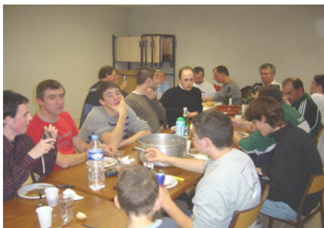
Le repas commun avec le club de Lacabarède