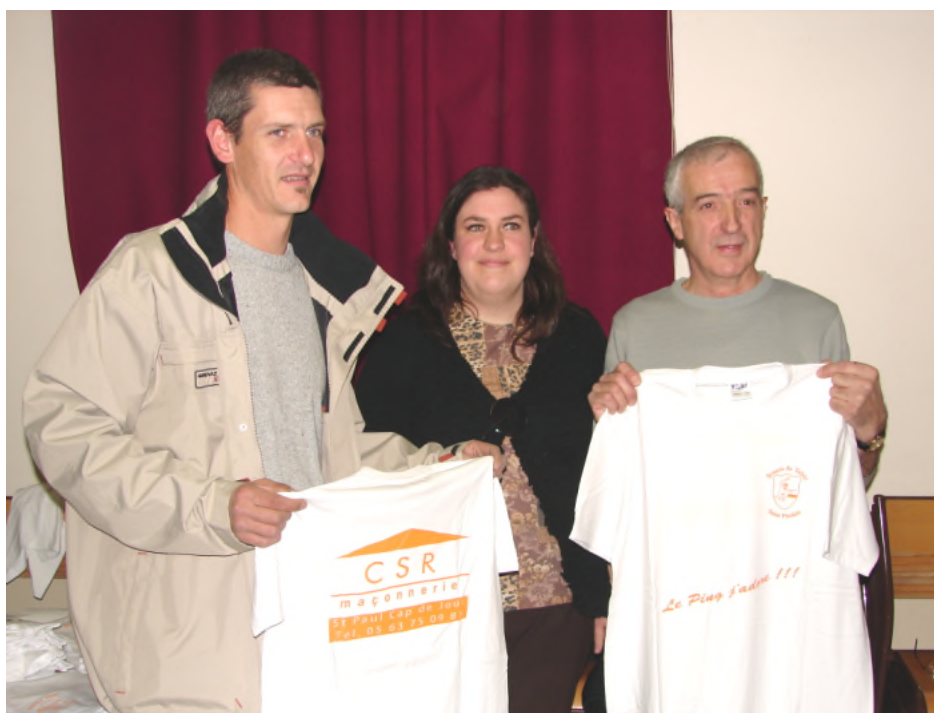
Maçonnerie Roncalli, un sponsor en béton